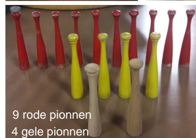
9 rode pionnen 4 gele pionnen 2 blanke pionnen